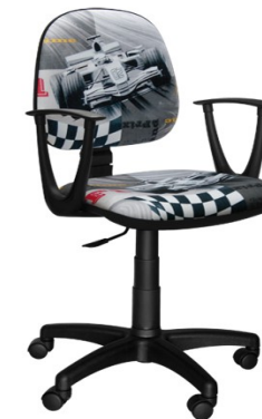
AREK F1 SZARY