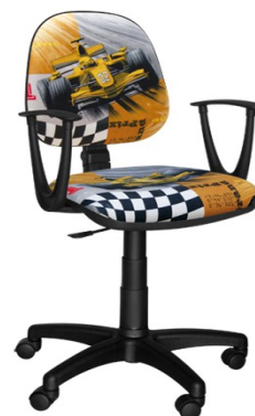
AREK F1 ŻÓŁTY