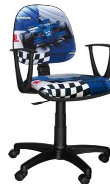
AREK F1 NIEBIESKI