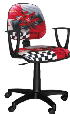
AREK F1 CZERWONY