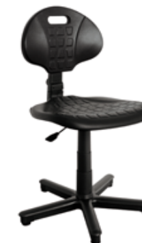
TULIP / TULIP 300