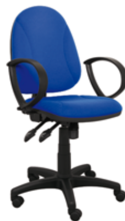
ERGO P SYNCHRO BL