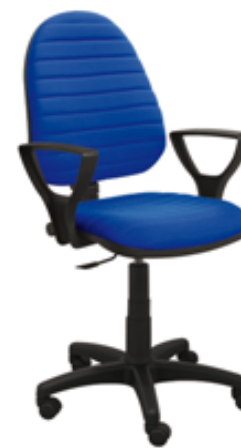
ERGO L BL