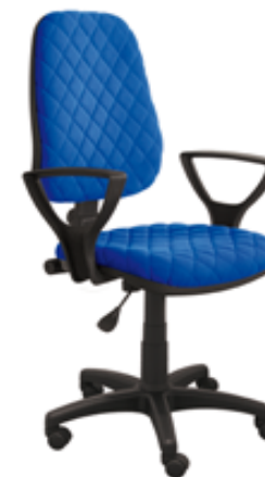
ALEKS KA BL