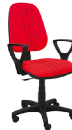
ALEKS P3 BL