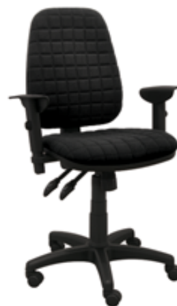
ALEKS KR SYNCHRO BL