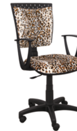
ZWIERZAK KOT 2