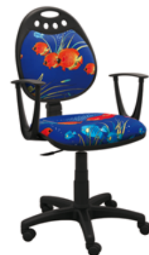
PRINCESS FISH 2