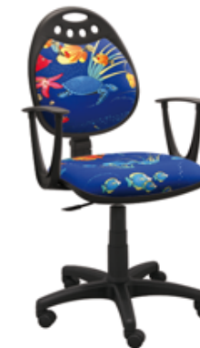
PRINCESS FISH 1