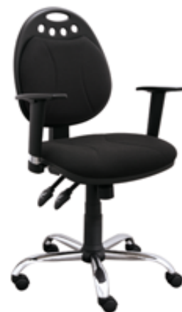
MAJA P SYNCHRO CH