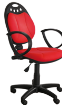
MAJA P BL